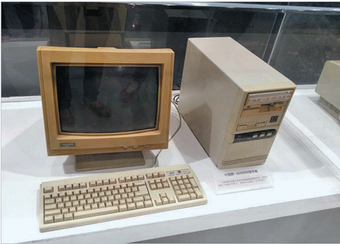
24小时运行的486服务器……

中国科技馆一楼展厅有这样一幅景象:一台486电脑摆放在玻璃橱窗中,12英寸的屏幕,米黄色的外壳,满满的岁月沧桑。旁边的说明上写着:“中国第一台WWW服务器。1994年建于中国科学院高能物理研究所,系统安装在一台486PC机上,24小时运行。”