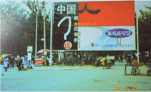
永恒的经典:中国人离信息高速公路有多远? (未完待续)

1995年,中国第一家网站“瀛海威时空”的广告牌“中国人离信息高速公路有多远?——向北1500米。”出现在北京中关村白颐路南端的街角处。现在回过头来看,作为中国第一家网站,瀛海威时空其实已经具备了 很多“超前”功能。