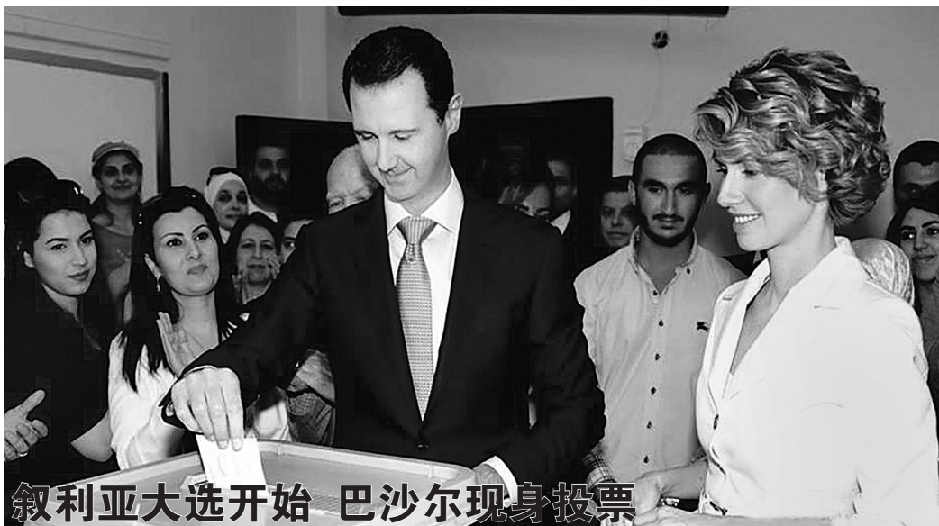
叙利亚大选开始 巴沙尔现身投票

乌克兰总统选举5月25日在深刻的政治危机和基辅当局在东部举行的大规模军事行动背景下举行，共有21位候选人角逐总统宝座。新当选总统波罗申科在计票期间就已表示，东部军事行动必须继续。