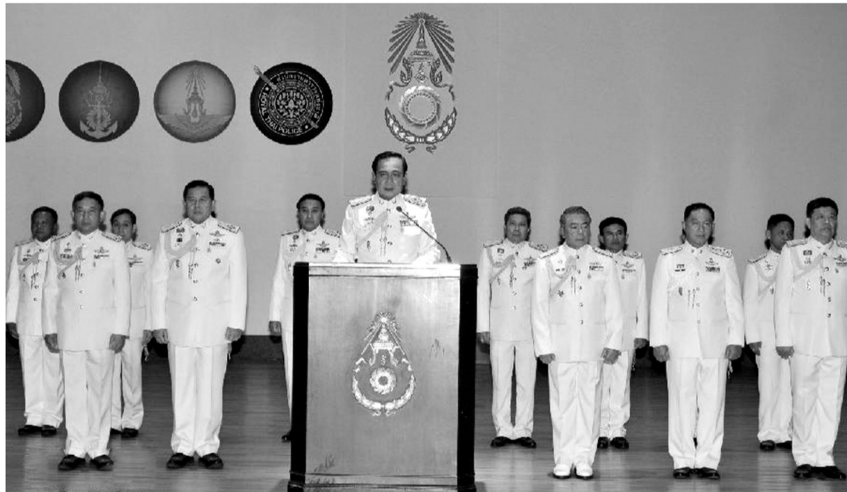
5月26日,在泰国曼谷,泰国陆军司令巴育(前)出席新闻发布会。

泰国陆军司令巴育26日接受国王谕令,出任“全国维持和平秩序委员会”(维和委员会)主席。巴育随后承诺国家将产生过渡总理,但拒绝透露具体时间。