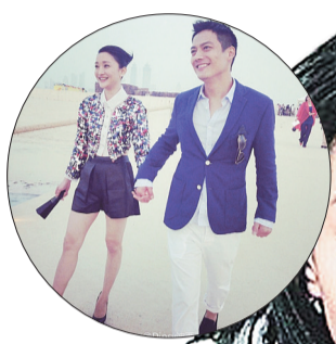
日前,周迅在迪拜参加某品牌的活动,男友高圣远陪同,两人在沙滩上幸福牵手,周公子笑比蜜甜,幸福甜蜜羡煞旁人。

继在微博公布照片并甩百度百科介绍男友之后,前日下午,周迅在微博发布了一篇名为《答客问》的长微博,回应了和高圣远恋情的发生、发展始末,再次被网友疯狂祝福。有意思的是,《答客问》最后一个问题是“有传你们年底会结婚”,下边的回答是“希望吧”。对此,有网友认为:迅哥儿这是准备公布婚期的节奏啊。