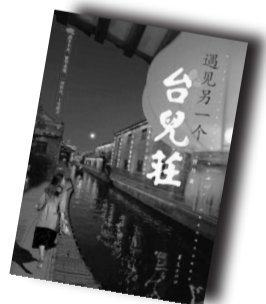
▲《遇见另一个台儿庄》▲ 华夏出版社 2013年8月出版

土耳其诗人纳其姆·希克梅特说：“在人的一生中，有两件东西不会忘记，那就是母亲的面孔和城市的面孔。”而今我们不仅要记住城市，更要找寻城市，找寻那些失去的诗意。繁华落尽，寂寞成殇。都市的繁华，却怎么也掩盖不住那一颗颗孤独的心，渐行渐远的山水，才是生命之根，才是人们长久的依恋。