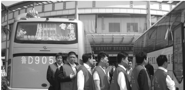
义工们有秩序地排起长队等候献血