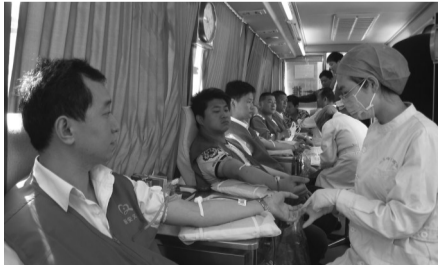
矿业集团新安煤业公司的义工为感恩母亲节在献血