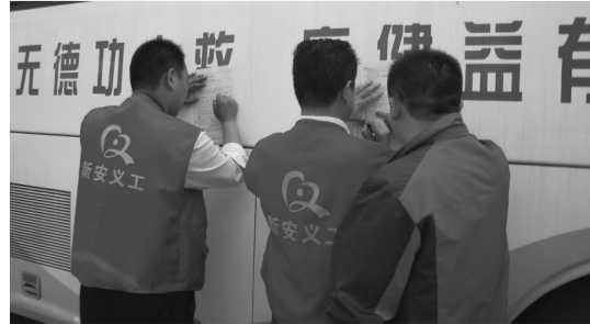
义工们在填写体检表