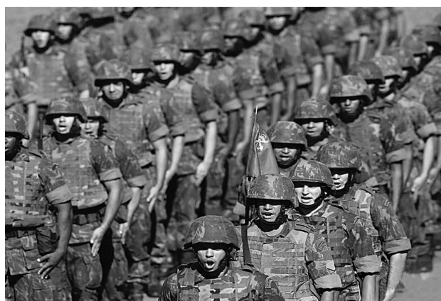
5月12日,巴西军方承担世界杯安保工作的队伍正式亮相。

据英国媒体12日报道,巴西世界杯赛即将于下月开始,巴西警方编写的一份传单,给游客提供了如何安全自处的“忠告”,其中包括在遇到打劫时“不要大声尖叫”。