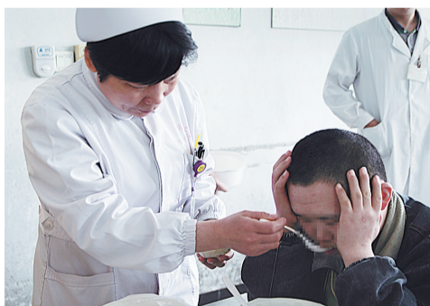
防止噎食 细心喂饭