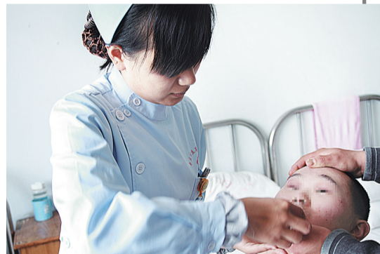
对于服药不便的病人护士亲自喂药