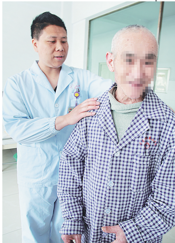
给“三无病人”整理衣服