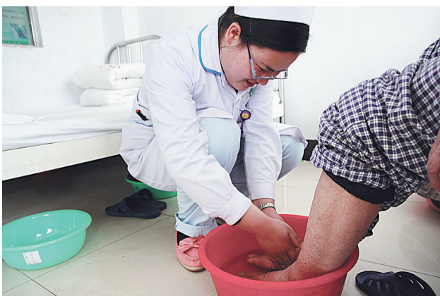
给行动不便的老人洗脚