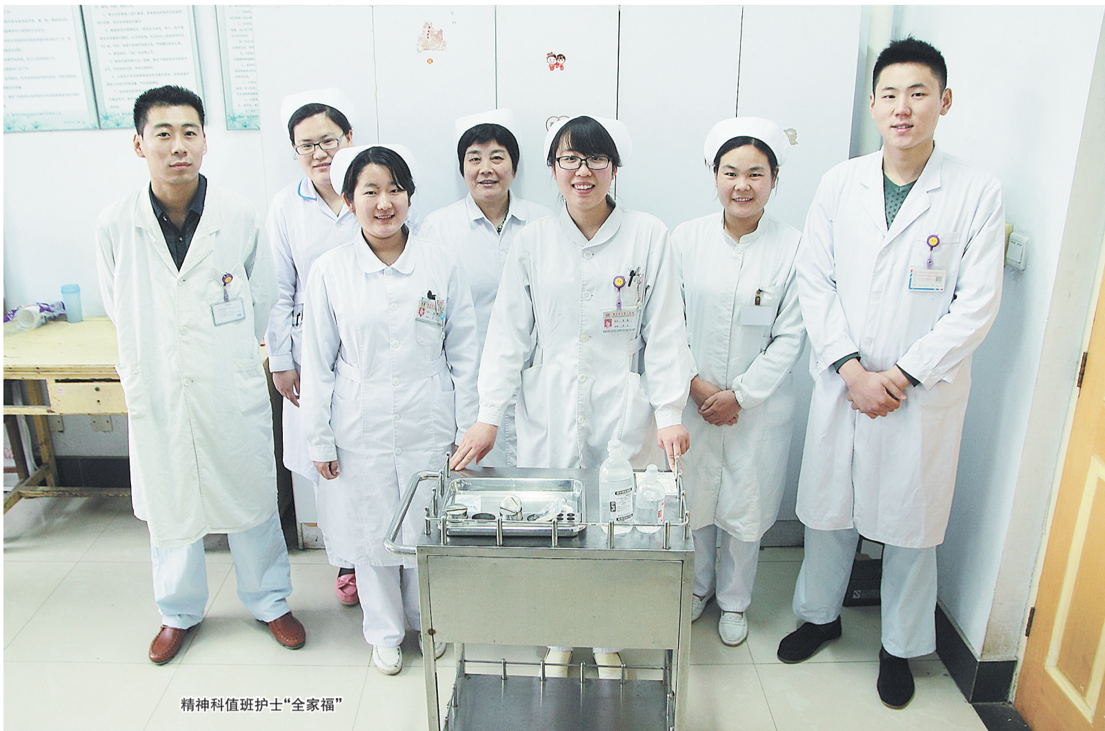
精神科值班护士“全家福”