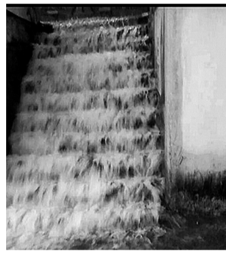
▲网友调侃“欢迎来广东看海”。