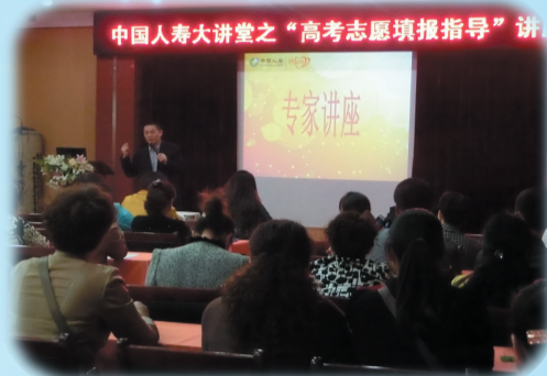
中国人寿大讲堂之“高考志愿填报指导”讲

为进一步提升客户服务水平、不断完善客户服务内容、加强与客户沟通,中国人寿枣庄分公司多年来通过邀请国内各领域知名专家、教授,根据客户的不同需求,举办“国寿大讲堂”活动,受到了客户的普遍欢迎及社会各界的高度赞扬。