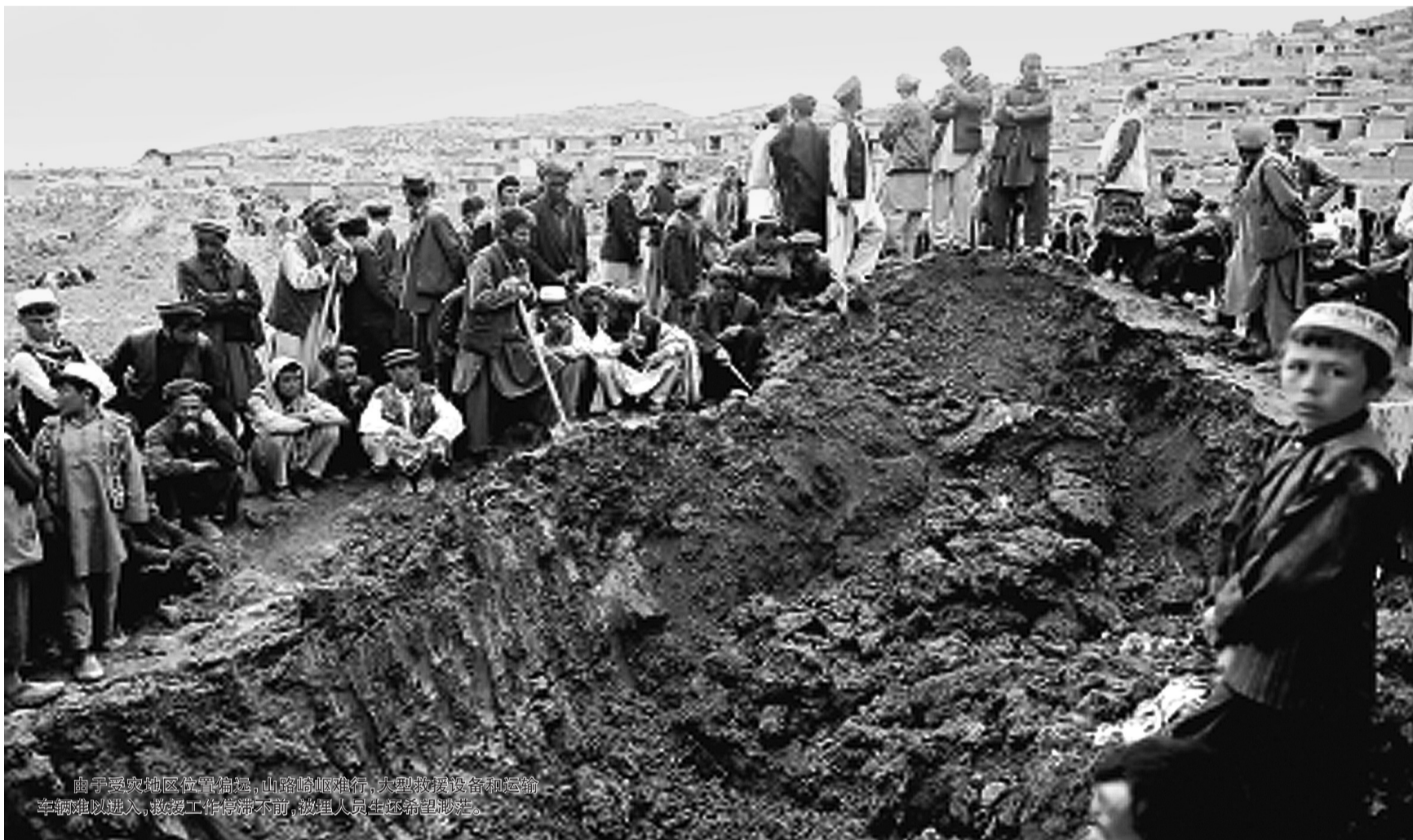
由于受灾地区位置偏远,山路崎岖难行,大型救援设备和运输车辆难以进入,救援工作停滞不前,被埋人员生还希望渺茫。