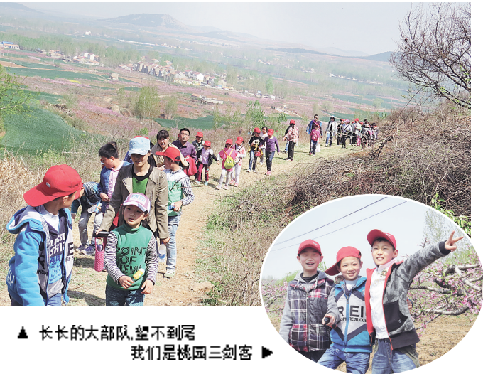
▲ 长长的大部队，望不到尾 我们是桃园三剑客 ▶

为了开拓学生的视野，增强学生的团结意识。近日，市中区光明路小学四年级四班的枣庄日报小记者开展了以“你我同行，快乐成长”为主题的春游活动。 在家长委员会的带领下，小记者们兴致勃勃地观赏了穆柯寨桃花，探索了神秘山洞，游览了贾汪督工湖美景。此次活动的开 展得到了学生和家长的一致好评，小记者们通过这次活动增进了友谊，增强了团结意识，收获了快乐，更享受了大自然的无穷魅力。充分发挥了家委会自主、协作、安全、严谨的作用，为学校各项活动的开展探索出一条新的途径。