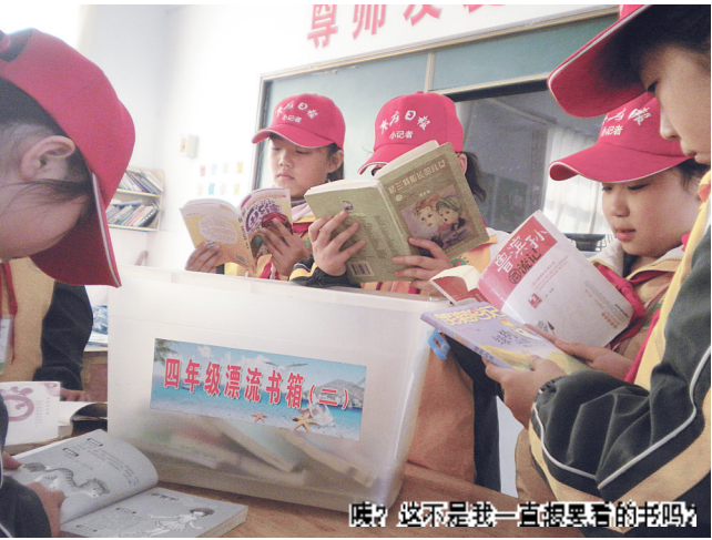
咦？这不是我一直想看的书吗？