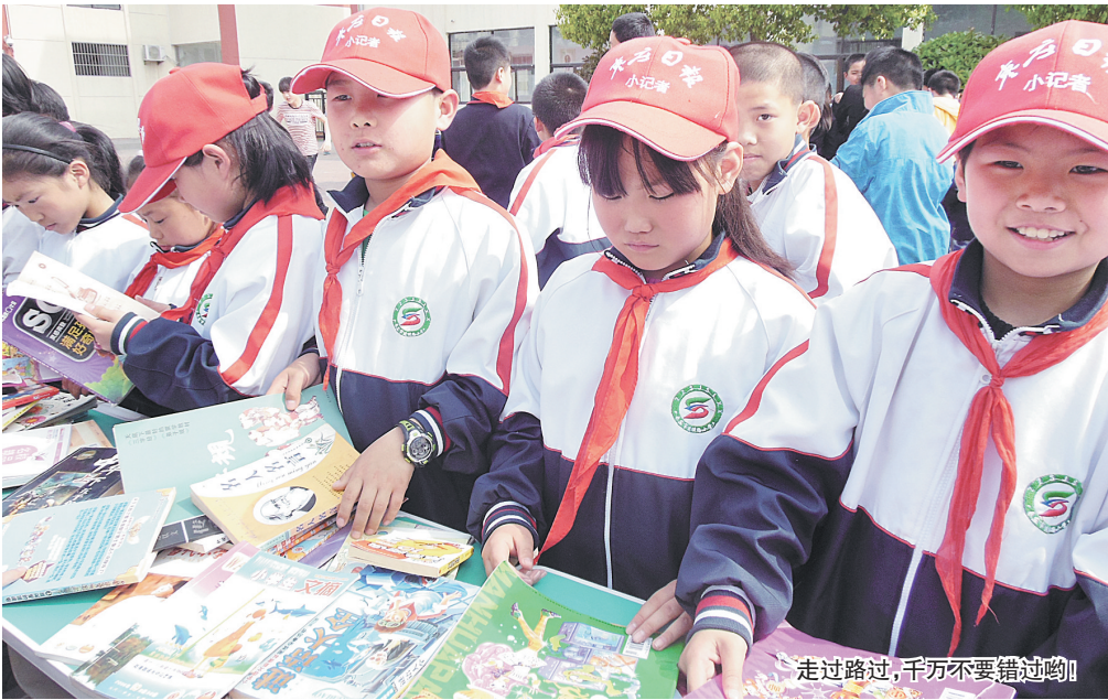
走过路过，千万不要错过哟！

为了开拓学生的视野，增强学生的团结意识。近日，市中区光明路小学四年级四班的枣庄日报小记者开展了以“你我同行，快乐成长”为主题的春游活动。 在家长委员会的带领下，小记者们兴致勃勃地观赏了穆柯寨桃花，探索了神秘山洞，游览了贾汪督工湖美景。此次活动的开 展得到了学生和家长的一致好评，小记者们通过这次活动增进了友谊，增强了团结意识，收获了快乐，更享受了大自然的无穷魅力。充分发挥了家委会自主、协作、安全、严谨的作用，为学校各项活动的开展探索出一条新的途径。