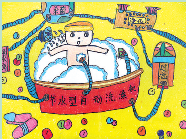
节水型自动洗澡机