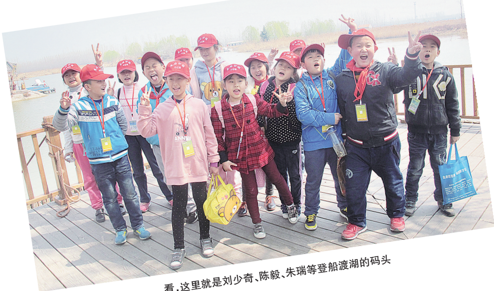
看,这里就是刘少奇、陈毅、朱瑞等登船渡湖的码头