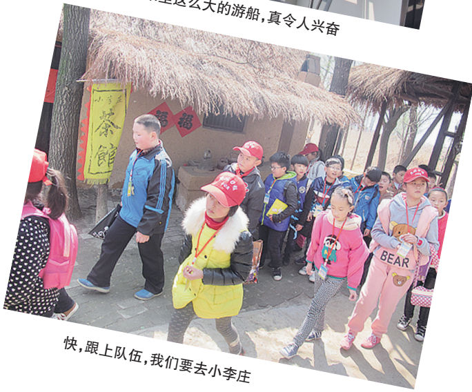
快,跟上队伍,我们要去小李庄