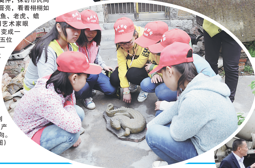
◀ 鳄鱼石雕好像真的一样