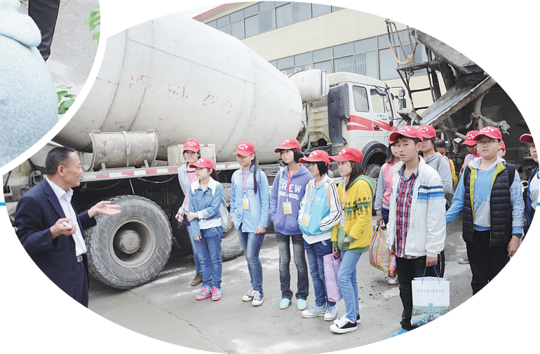
小记者们,你们知道砼车吗? ▼