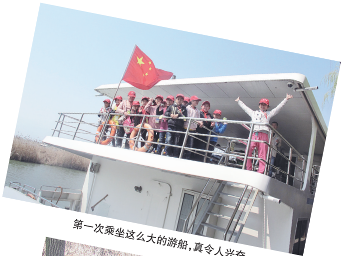
第一次乘坐这么大的游船,真令人兴奋