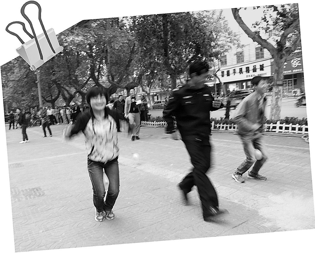
近日,在中政务中心青年趣味减压运动会上,“吹爆气球”、“背夹球跑”、“企鹅快跑接力赛”等比赛项目吸引了60多人参加。