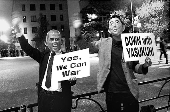
23日,在日本东京,两名抗议者头戴美国总统奥巴马和日本首相安倍晋三形象的面具参加抗议。

反对在冲绳边野古新建美军基地的野村女士说,她坚决反对对日美再次把冲绳打造成战争基地,冲绳的美军基地和自卫队基地都应该搬走。