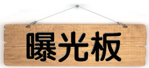
近日，在峰城区某小区里，有居民占用了小区内的健身器材和锻炼场地晾衣晒被，部分居民对此表示不满。