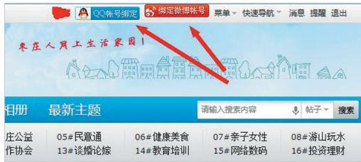
图1:用您的枣庄论坛账户登陆了之后,点击网页右上角的“QQ帐号绑定”或“绑定微博帐号”(也可进入个人资料找到相应功能)即可进行帐号绑定操作。