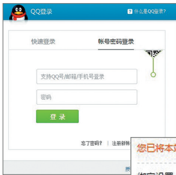
↑图2:使用您想绑定的QQ帐号和密码登录。

如(图4)“QQ绑定”设置页面里有下面两个设置选项:“发表主题时默认发送动态到QQ空间”“发表主题时默认转播到腾讯微博”。选择后在论坛发的任何主题帖都会同时自动更新到您的QQ空间和腾讯微博上。