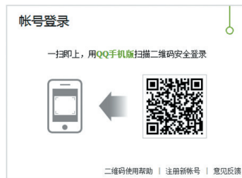
图3:直接用QQ手机版扫描二维码安全登录。