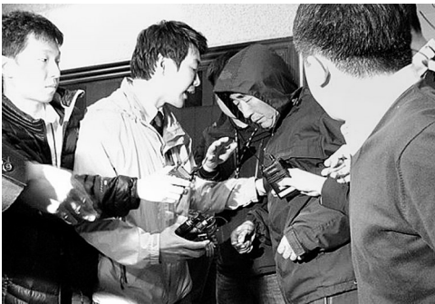
沉没客轮船长接受调查后离开。