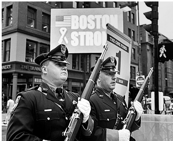
在波士顿马拉松爆炸现场附近，仪仗队员从写有“坚强 波士顿”的显示屏前走过

“唐纳德·库克”号驱逐舰属于美国阿利·伯克级驱逐舰，配备有“宙斯盾”防空反导系统和“战斧”式巡航导弹。法新社说，美军派遣这艘驱逐舰前往黑海，是为表示对东欧地区北约盟友的支持。