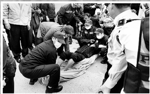
▲救援人员正在转移一名客轮上的乘客