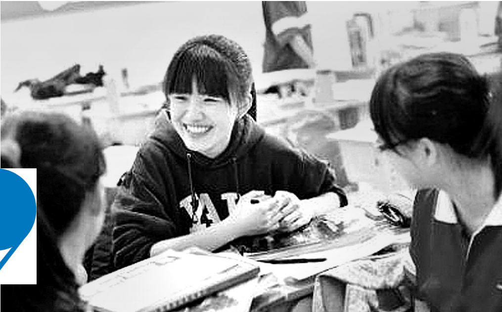
▲这个可以用“漂亮”和“明星气质”来形容的小女生，成绩好得足以亮瞎你的眼睛。

而按照大众审美，她还是标准美女一枚，但这样的漂亮女孩爱好的不是梳妆打扮，却是解各种数学难题。