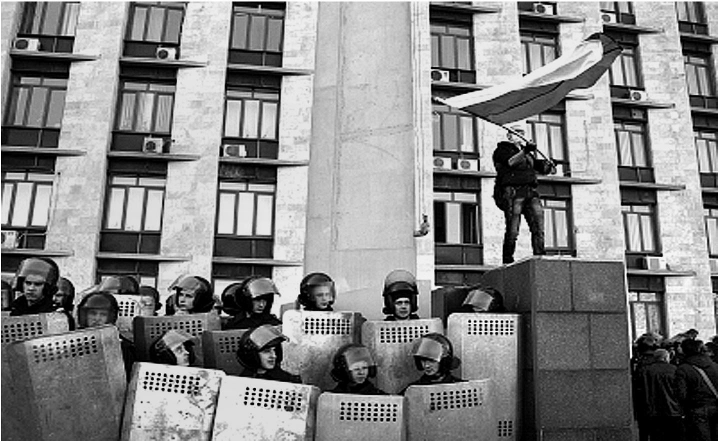
四月六日，在顿涅茨克，亲俄示威者在地方行政大楼前挥舞俄罗斯国旗。