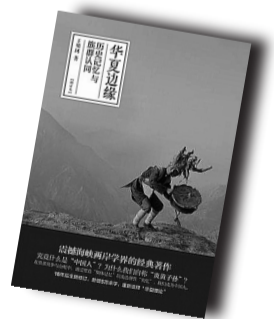
▲《华夏边缘：历史记忆与族群认同》▲ 浙江人民出版社 2012年11月出版

在此时代背景下，接受“民族主义”与相关“民族”概念洗礼的晚清中国知识分子，忧心西方列强势力在中国及其周边地区的扩张，极力呼吁民族团结及唤醒国魂。在早期革命派人士排满兴汉之民族意识下，这个国族曾指的是传统“中国”概念中受四方蛮夷包围的“汉族”，也就是华夏；在较能包容满族的立宪派知识分子心目中，此国族则包含满、蒙等族。后来在欧美列强积极营谋其在西藏、蒙古、东北与西南边区利益的情况下，合“华夏”(核心)与“四裔蛮夷”(边缘)而为“中华民族”的国族概念，逐渐成为晚清许多中国知识分子心目中的国族蓝图。在此国族蓝图下，近代中国知识分子一方面书写国族历史(或民族史)，一方面重新认识及描述