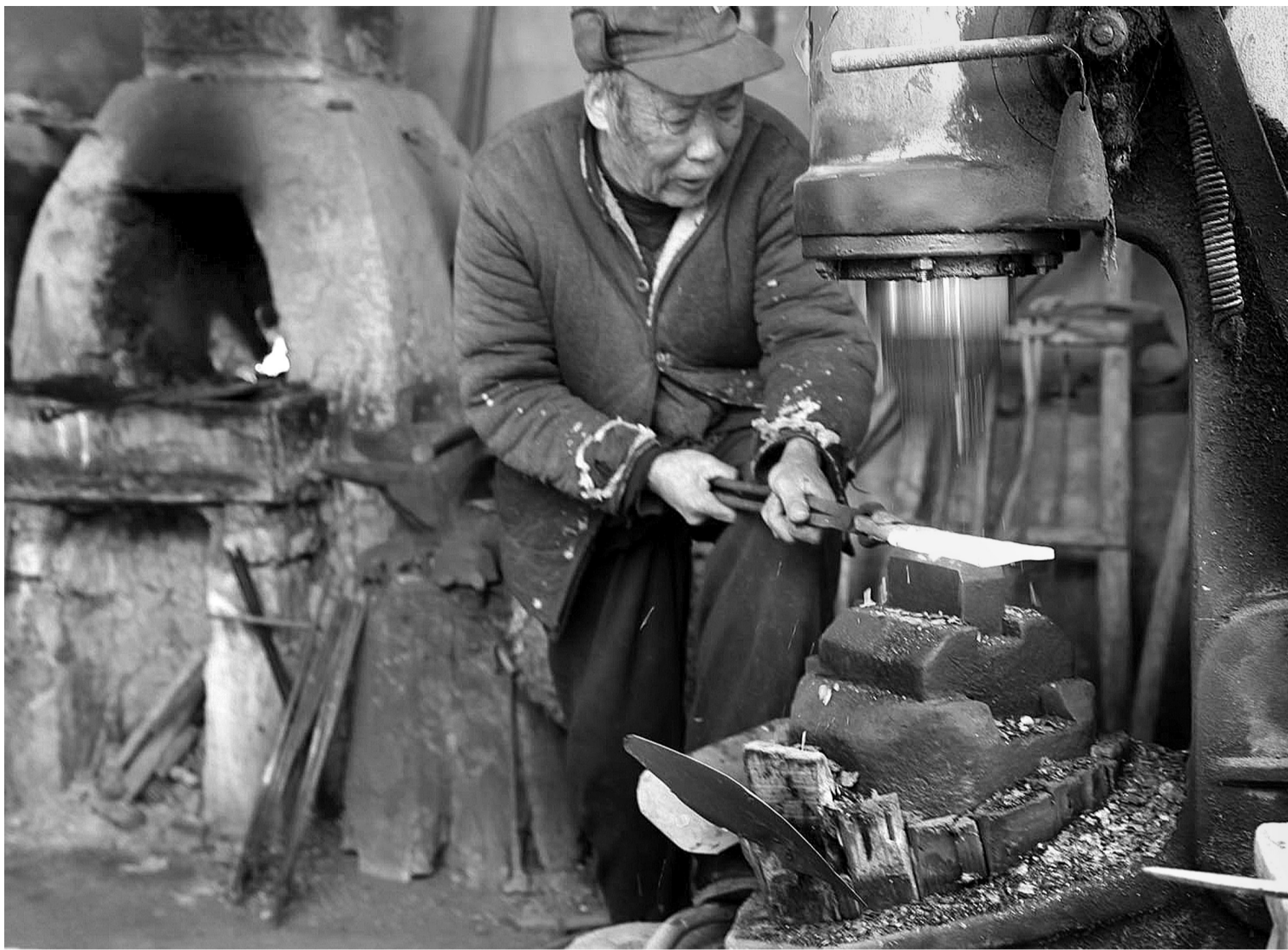
为了省点力气，老人狠狠心买了台电动打铁机，这下可方便多了