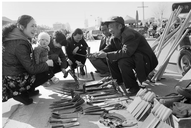
不管是什么铁家什，他都坚持诚信第一，他说，干了一辈子了，可不能落个窃名声