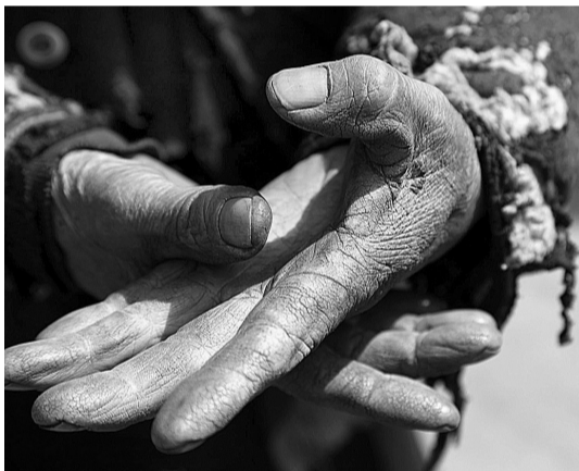
长年打铁，老人手上结了层厚厚的老茧