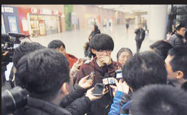
故障飞机上的一名乘客在讲述事件过程