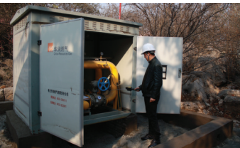
图为安技部工作人员对新调压柜进行安全检测

枣庄华润燃气圆满完成立新小区燃气调压站迁移工程。 枣庄华润燃气公司的立新小区调压站始建于1993年,负担立新小区5000余户的调压供气工作。