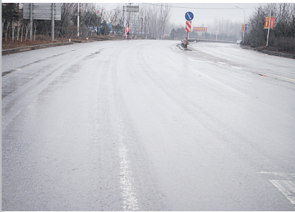
北外环与解放路交叉口道路中心线模糊

会对其进行补刷。所以,希望广大市民在遇到这种情况时可以及时向我们反映,我们会根据市民反映的情况及时核实,尽快解决。”该负责人说。 对于市民担心的因为看不清导向线而违反交通规则的问题,该负责人回答说:“如果确实因为看不清行车线、导向线而导致的违规,可以考虑减轻甚至免去处罚,但如果发现是借着导向线看不清的理由来故意违规的话,我们也会对其进行加倍处罚。” (记者 寇光 董艳 文/图)