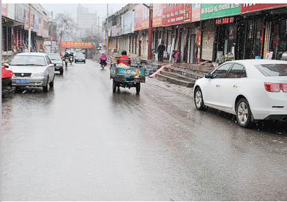
兴安街没有道路中心线