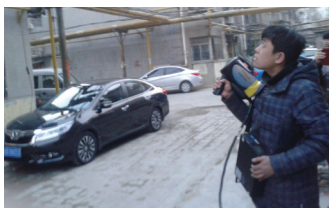
图为工作人员用激光遥测检漏仪进行检测

工,4个小时顺利完成迁移供气。在新调压器启动运行后,燃气公司工作人员利用移动广播设施及时告知辖区居民,并由公司客服部组成14个安检小组,对调压站辖区内