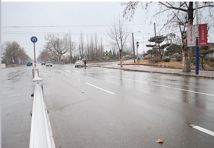
解放路与人民路交叉口没有导向线