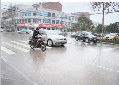
龙庭路、龙头路交叉口没有导向线,车辆逆行