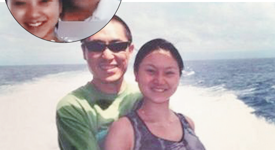
■张艺谋、陈婷合影。同一个场景,张卫平、陈婷也有合影。