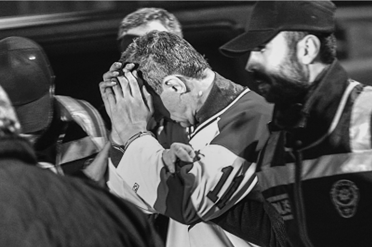
2月7日,在土耳其伊斯坦布尔的萨比哈·格克琴国际机场,警察在押送企图劫机的男子(中)。