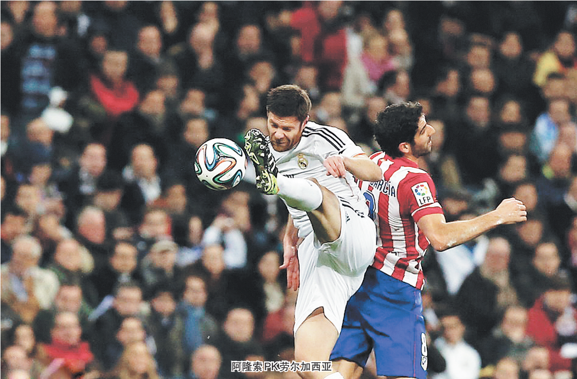
阿隆索PK劳尔加西亚

马德里竞技既是西甲“领头羊”又是西班牙国王杯卫冕冠军，但昨晨在国王杯半决赛首回合遭遇重创，客场以0比3惨败于同城死敌皇家马德里。这是上赛季国王杯决赛的重演，皇马此番全面压制对手，让马竞下一回合在主场几乎没有逆转的可能。 场上原本最引人注目的球星是C罗，当地时间2月5日晚恰好是他的29岁生日，“寿星公”留了超酷的新发型出场比赛。由于上周末在西甲被红牌罚下，C罗5日收到在西甲被停赛3场的严厉罚单。1张红牌自动带来1场停赛，但C罗当时在离场时向裁判做了用手拍打自己脸部的动作，这被认为是对裁判权威的挑衅，因此又被追加两场停赛。错过对维拉利尔、加