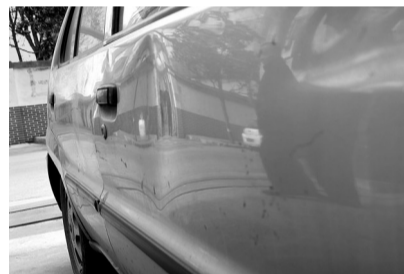
一夜间惨遭破相的车辆