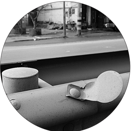
反光镜上蒙了一层厚厚的灰尘