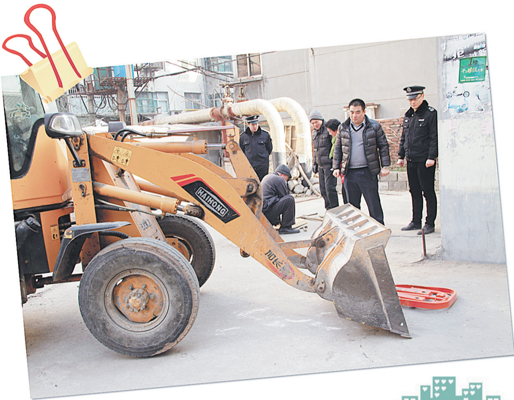
近日,市中区文化路街道执法人员对立新小区内私自占据公共资源设置的停车器具进行了集中清理整治。据了解,此次共清理小区内挡车柱、挡车架、立柱座等停车器120余处。