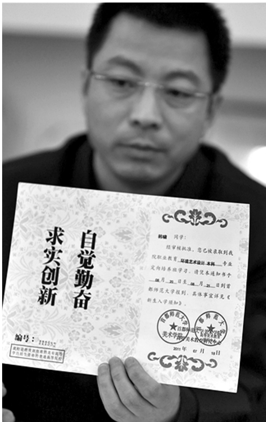
2013年12月30日,首师大美术学院党委书记出示被骗学生的录取通知书,表示“本科”字样是由招生公司虚假宣传、擅自添加。

常建勇表示,通过和学生的沟通,达成最终协议。这71名学员中,有3人离开高美中心,每人获8万元补贴。其余68人每人获7万元补贴,继续在中心学习,他们将于2015年1月获得成人教育专科学历。