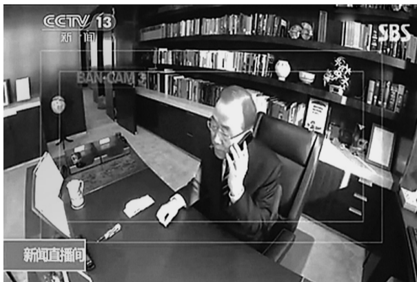
潘基文在电话里压低声音说“我给现金,快把东西送来”。