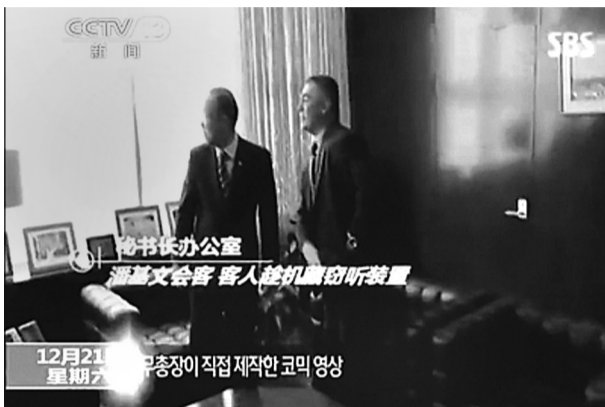
客人转移潘基文注意力后,迅速从口袋里掏出并安装窃听装置。

联合国随后就美国情报机构窃取联合国通信信息一事质询美国政府。10月30日,联合国秘书长发言人内西尔基表示,美国政府已经做出保证,目前以及今后都不会对联合国的通讯进行监控。