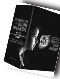
《饥饿游戏：三部曲典藏版》 苏珊·柯林斯 著 作家出版社