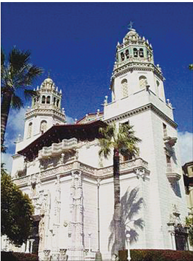
在罗亚尔港遗迹里发现的具有海盗特色的装饰品

16世纪,中、南美洲是西班牙的天下,殖民强盗搜刮了大量金银财宝,一船船运回欧洲。在入侵西半球方面,英国落后西班牙一步,除了控制北美洲北部地区以外,很难染指西班牙的势力范围。心理不平衡的英国嫉妒西班牙抢到的巨额财富,就怂恿海盗专门袭击西班牙的船只,并为之提供庇护所。与此同时,欧洲一些亡命之徒沦为海盗,在美洲沿海抢劫过往商船,特别对抢劫西班牙皇家的运金船更感兴趣。英国政府当时专门辟出英属殖民地牙买加岛东南岸的罗亚尔港作为海盗的基地,罗亚尔港于是成为历史上海盗船队的最大集中地。