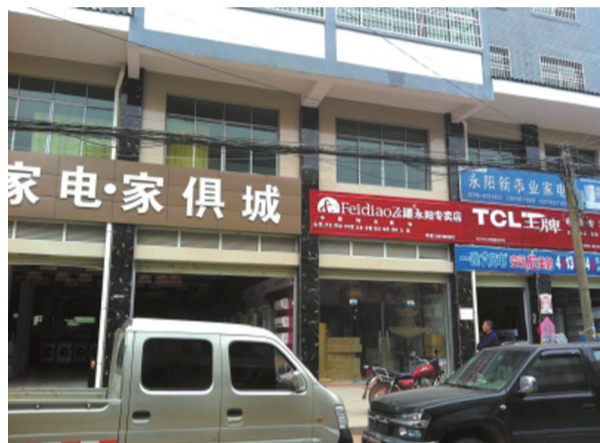
在江西吉安某乡镇,一条街上的十余家家电经销商全都被追缴骗补资金,骗补率多者超过50%。

执行了4年的家电下乡政策今年初结束,江西省吉安市多个县区的经销商反映,几乎所有网点均被要求上缴“骗补”资金,比例达总补贴额的20%-50%。吉安市相关部门则称,各县上报追缴率在10%-20%。由于“骗补”达到5000元即可以诈骗、贪污等罪名入刑,大多数经销商选择交钱,部分顽固分子被拘留,并额外交保证金取保候审。经销商承认确实有违规操作,但要求给出处罚依据,而调查部门称是机密拒绝透露。