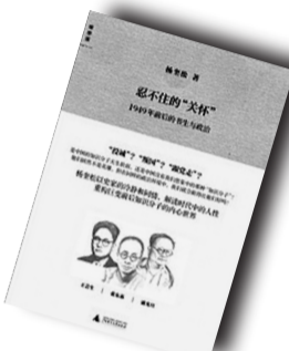
▲《忍不住的“关怀”》▲ 作者:杨奎松 广西师范大学出版社

作者简介: 曹寇,1977年生。已出版小说集《越来越》和《屋顶长的一棵树》,长篇《十七年表》,随笔集《生活片》。现居南京。