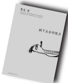
▲《躺下去会舒服点》▲ 作者:曹寇 中国华侨出版社

作者简介: 乔治·维加埃罗,法国大学研究院成员,巴黎第五大学历史学教授,法国社会科学高等研究院研究主任。他曾撰写了许多有关人体描述的著作,其中有《被矫正过的人体》《洁净与肮脏:中世纪以来人体的卫生》等。