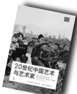
▲《20世纪中国艺术与艺术家》▲ 作者:托尼·朱特 商务印书馆出版

作者简介: 熊权,湖南益阳人,北京大学中文系博士,河北大学副教授,硕士生导师。主要研究中国左翼文学、中国现当代文学思潮等。已出版著作《大家小集:茅盾》、《“革命加恋爱”现象与中国左翼思潮研究》等。