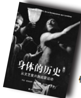
▲《身体的历史》▲ 作者:[法]乔治·维加埃罗 新星出版社

作者简介: 杜维明,第三代新儒家代表,北京大学高等人文研究院院长,美国人文科学院院士,并曾应联合国前秘书长科菲·安南的邀请参加为推动文明对话而组建的“世界杰出人士小组”。1981年起在哈佛大学任教,1996年担任哈佛燕京学社社长,2008年创立北京大学高等人文研究院。