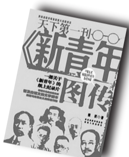
▲《〈新青年〉图传》▲ 作者:熊权 陕西人民出版社

作者简介: 杨奎松,历史学家,主要从事中外关系史、中国近现代史等方面的研究。曾先后任中国社会科学院近代史研究所研究员、北京大学历史学系教授,现为华东师范大学终身教授、紫江特聘教授。