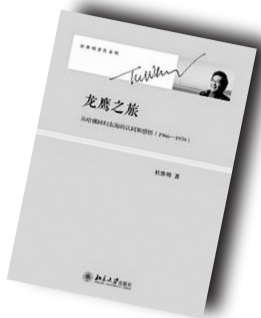
▲《龙鹰之旅》▲ 作者:杜维明 北京大学出版社

内容简介: 杜维明50年求学治学3部曲《龙鹰之旅》《迈进“自由之门”的儒家》《现龙在田》以充满才情的文字,向我们娓娓讲述了一个学者游历世界名校所感受的心灵震荡!