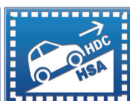
HDC/HSA 陡坡缓降/辅助上坡起步