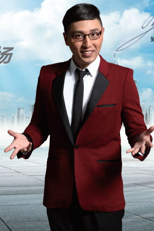
知名节目主持人:华少