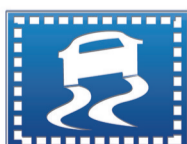
ESC 车身电子稳定控制