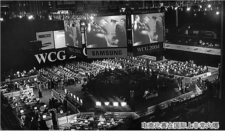
电竞比赛在国际上非常火爆

“我们明年还会和华奥星空合作,现在在和SMG游戏风云进一步沟通,还有其他游戏厂商,只要有志于推动中国电竞产业化发展的所有合作伙