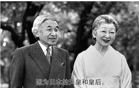
图为日本的天皇和皇后。

据日媒14日报道，日本宫内厅发表消息说，天皇和皇后陛下在过世后，将改变迄今为止土葬的方式，采用火葬。