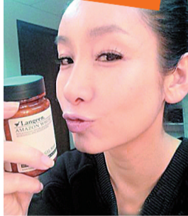
■秦海璐努力推销某款护肤品

近年来明星热衷开网店已不新鲜,“双十一”对于他们来说也是一个商机。唐禹哲、陶晶莹等就都赶在“双十一”前几天火速将网店开到了淘宝上。据悉,目前各路明星在淘宝开的网店已经超百家,而明星店主们还纷纷推出各种优惠政策。