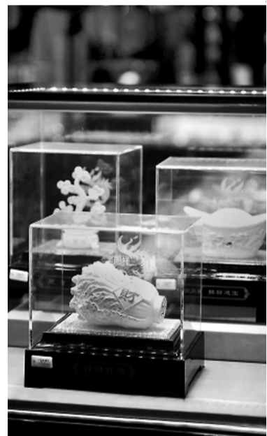
黄金产品持续热卖