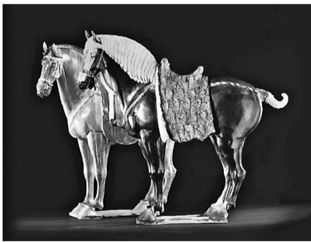
9月17日，纽约苏富比秋季拍卖会上拍卖的一对唐代三彩马