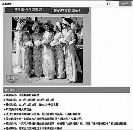
光棍节前，某网站挂出越南新娘资料图片

但对于越南新娘中介的合法性，相关部门表示，对于从事涉外婚姻介绍的机构，早在1994年，国务院办公厅就下发《关于加强涉外婚姻介绍管理的通知》，其中明确规定：严禁成立涉外婚姻介绍机构。国内婚姻介绍机构和其他任何单位都不得从事或变相从事涉外婚姻介绍业务。任何个人不得采取欺骗手段或以营利为目的从事或变相从事涉外婚姻介绍活动。（据北京青年报）