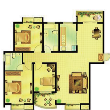
(C014) 东湖阳光 3室2厅2卫 面积:147.22平米

这是优山美地炙手可热的户型之一，该户型设计方正、南北通透；客厅、餐厅一体，且区划分明，无走廊、过道，更显空间开阔气派；卧室带南向飘窗，是明媚温馨之居；客厅带大尺度景观阳台，可以尽享室外酣畅园林景观致。