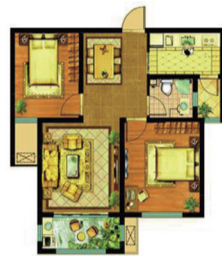
(A035) 美星花园 2室2厅1卫 面积:94.4平米

贴心舒适的恬静小户型。这款经得起推敲的小户型为人们营造舒适的家感觉。户型设计方正大气，南北通透；南北双阳台设计让室内通风采光俱佳；家居生活，各功能区合理；南向客厅连接观景阳台，让您肆意欣赏生活美景，舒适、快乐油然而生，这是一款不可多得舒适型小户型。