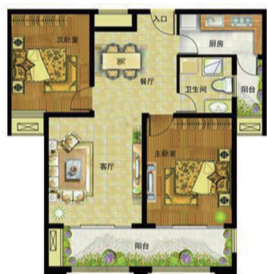
(B044) 远航·未来城 2室2厅1卫 面积:108平米

精巧灵动的优质户型，功能完备，方正实用；超大观景阳台，在闲暇休息时可远眺无限风光；宽敞的客厅与餐厅融会贯通，最大限度拓展生活空间，让生活更惬意。