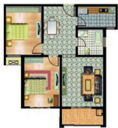
(A004) 中安·道南里 2室2厅1卫 面积:98平米

紧凑舒适、人性化设计的小户型。该户型方正实用，结构紧凑，舒适合理；客厅连体落地阳台，让视野豁然开朗，美景一览无余；豪华主卧，空间开阔，亲近自然，采光充足，尽显都市生活时尚新风，让主人在美景中休憩。