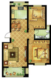
(A030) 江北绿城 2室2厅1卫 面积:87.46平米

紧凑舒适、人性化设计的小户型。该户型方正实用，结构紧凑，舒适合理；客厅连体落地阳台，让视野豁然开朗，美景一览无余；豪华主卧，空间开阔，亲近自然，采光充足，尽显都市生活时尚新风，让主人在美景中休憩。