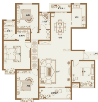
(C024) 优山美地 4室2厅2卫 面积:188.2平米

这是优山美地炙手可热的户型之一，该户型设计方正、南北通透；客厅、餐厅一体，且区划分明，无走廊、过道，更显空间开阔气派；卧室带南向飘窗，是明媚温馨之居；客厅带大尺度景观阳台，可以尽享室外酣畅园林景观致。