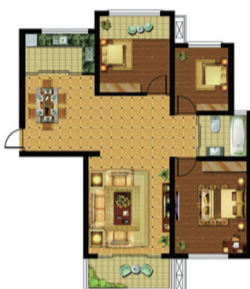
(B052) 亿和嘉苑 3室2厅1卫 面积:104.18平米

该款户型是购房者最喜爱的户型之一。拥有超大观景阳台，南北通透，户型方正大气，无浪费面积，实用率高；双阳台设计，将社区景观尽收眼底；采用全明设计，确保每个房间都有良好的通风和采光。