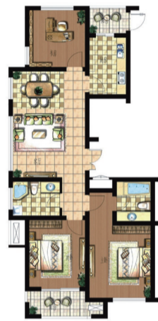
(B081) 东湖龙城 3室2厅2卫 面积:131.50平米

百余平米的户型，却巧妙地做到了精致紧凑的三房设计。室内采光充足，是典型的通透设计，过道与餐厅自然衔接，充分利用了灵动空间，让业主在有限的空间里享受到更舒适的生活。