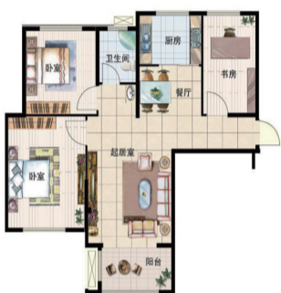
(B002) 闽峰·赛纳斯城 3室2厅1卫 面积:116平米

精巧灵动的优质户型，功能完备，方正实用；超大观景阳台，在闲暇休息时可远眺无限风光；宽敞的客厅与餐厅融会贯通，最大限度拓展生活空间，让生活更惬意。