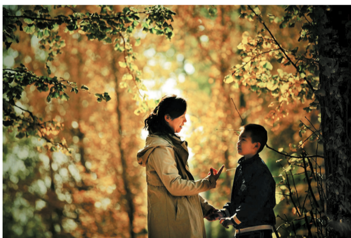
秋天的故事