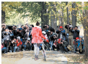
采风掠影 晓民摄影 摄