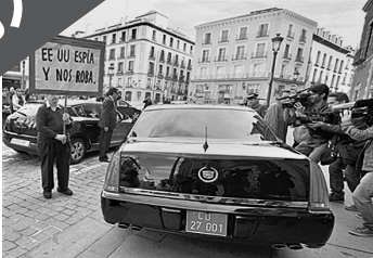
28日,美国大使乘车赴西班牙外交部解释监听事件,民众举着写有美国间谍字样的牌子进行抗议。