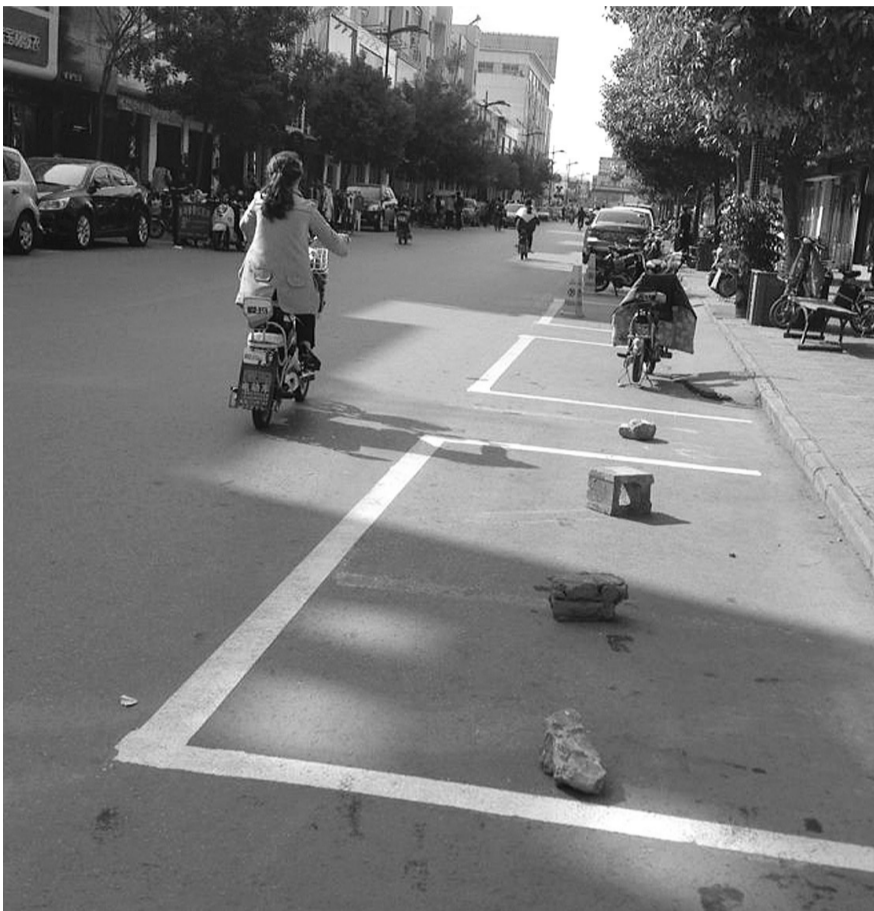
接连几个车位被占

了他们的生意。据了解,本来吉品街来往的车辆就多,停车位也很紧张,店主这样把车位给霸占了,导致一些购物的市民无法停车,只能将车辆不按规定地乱放,甚至出现两辆车并排停放的情况,这样又给本来就拥挤的吉品街增加了新的交通压力。记者在此的一个多小时里,切身感受到私占停车位给过往顾客带来的诸多不便。希望相关部门能尽快处理这种不文明的行为,把公共车位还给大家,给市民营造一个良好的停车环境。