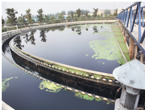
现代化的污水处理设施