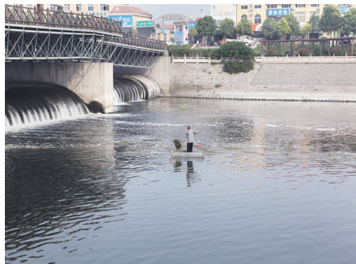
老人划着铁皮小舟打捞水草