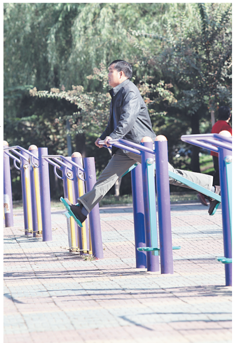
河边空气清新,在此健身更让人心情舒畅