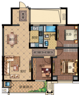
B 011 和家园 三室两厅一卫 面积:113平米