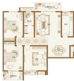
B 067 优山美地 三室两厅一卫 面积:132.3—134.2平米