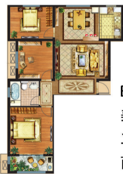
B 083 美星花园 三室两厅一卫 面积:117.35平米