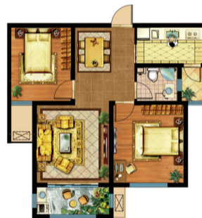
A 035 美星花园 两室两厅一卫 面积:94.4平米