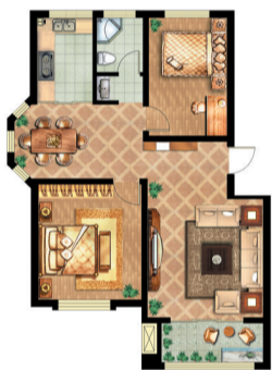
A 032 江北绿城 两室两厅一卫 面积:90.2平米

(排名不分先后,更多户型及详细资料请登录枣庄新闻网“金牌户型”评比主页进行查看并投票。)