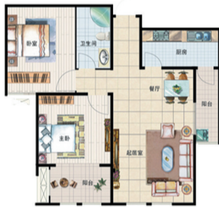
A 005 塞纳新城 三室两厅一厨一卫 面积:90.25平米