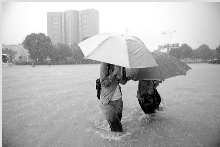
10月7日,在杭州市西溪路一处路段,几位行人涉水通过齐膝深的积水。杭州市气象台当日13时20分发布暴雨蓝色预警信号,预计下午到夜里杭州市阴有中到大雨,北部山区局部暴雨。