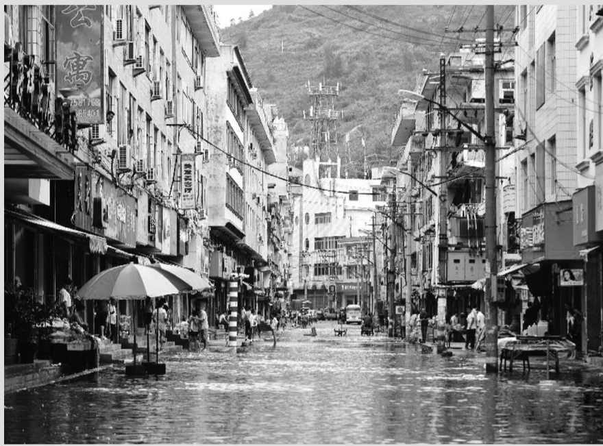
10月7日凌晨1时15分,强台风“菲特”在福建省福鼎市沙埕镇登陆,登陆时中心附近最大风力14级。

预计未来24小时,江苏南部、安徽东南部、浙江北部、上海北部等地的部分地区有大雨到暴雨,浙江西北部局地有大暴雨,部分地区的降雨量可能超过100毫米。